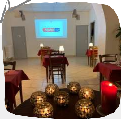
La salle paroissiale métamorphosée pour accueillir les couples !

Nous sommes un couple toujours très amoureux. Ensemble depuis 30 ans et mariés depuis 20 ans, nous avons confiance dans notre couple que nous sentons solide.